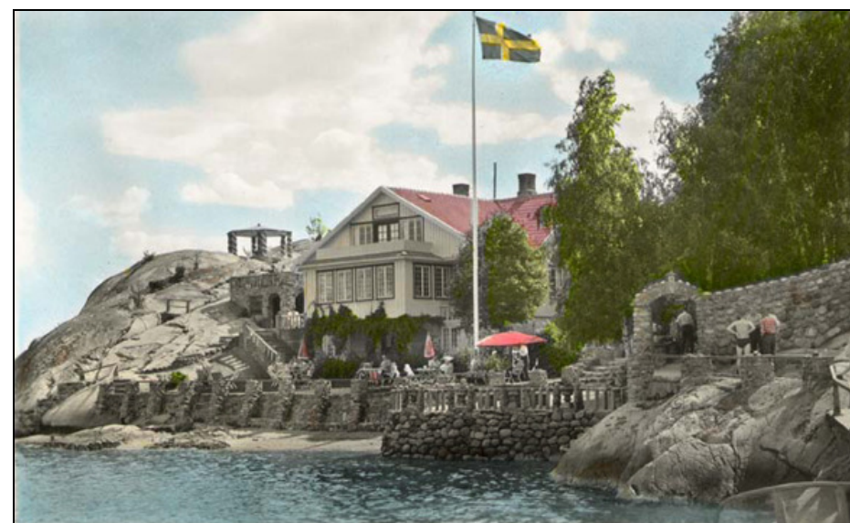
Se Kring kaffebordet .